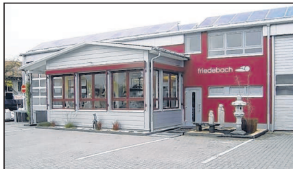
Die moderne Schatzzentrale der Firma Friedebach.