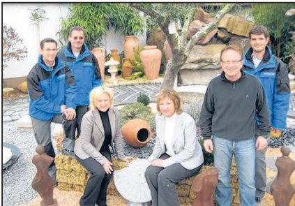
Das Friedebach-Team stellt den Besuchern am kommenden Wochenende das Unternehmen mit all seinen Angeboten vor.